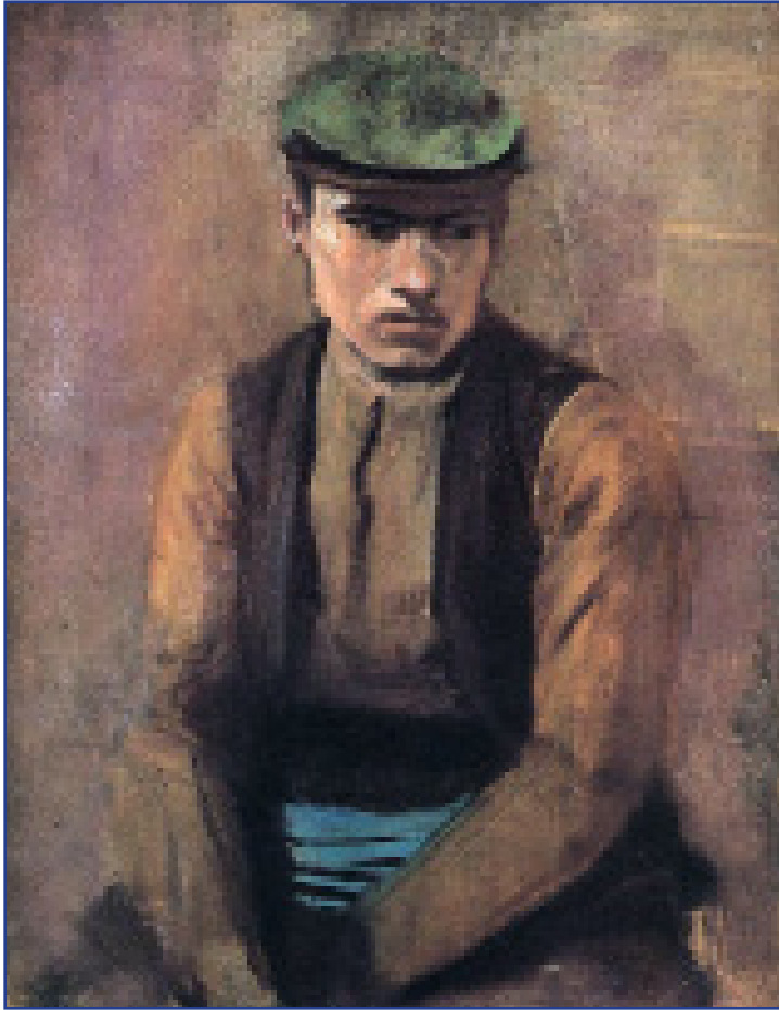
Page couverture : Le journalier László Mednyánszky, peintre (1852-1919)